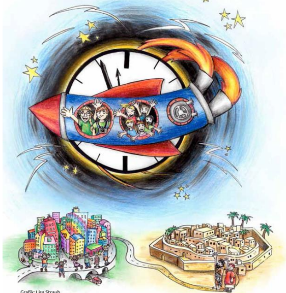
Grafik: Lisa Straub

Wann? In den Osterferien 05.04. -07.04.18 von 9-12 Uhr